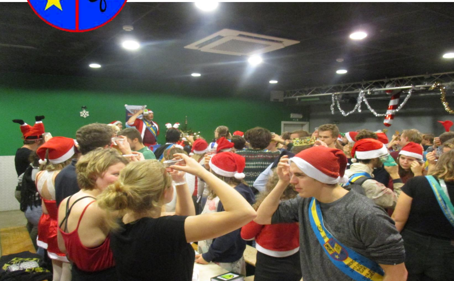
Het was alvast heel gezellig bij Eros

Wekelijks blaadje van studentenkring Wina verspreid onder studenten wiskunde, fysica en informatica.