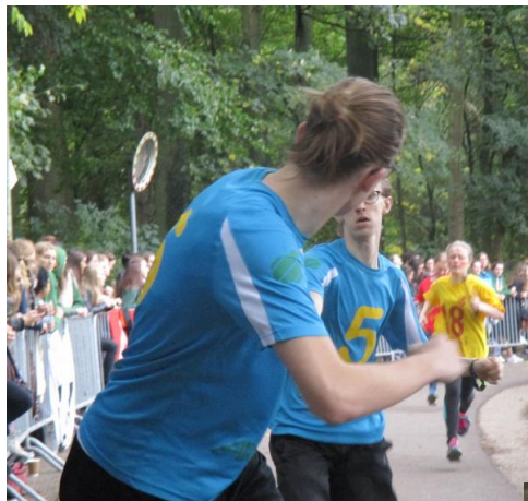
Natuurlijk werd er hard gelopen overdag ...