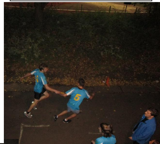
... en 's nachts.

Om ten slotte een geslaagde 24 urenloop en de 7e plaats weer eens te vieren op de post 24 urenloopbar.