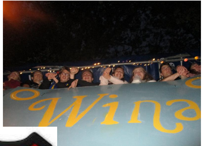
Een groter standje met een extra verdieping voor de supporters.