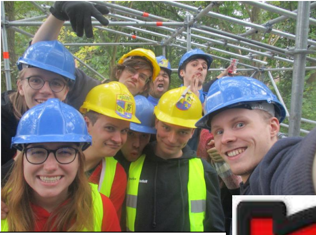
Wat maakt ons sterk? TEAM-werk !!! (sic)