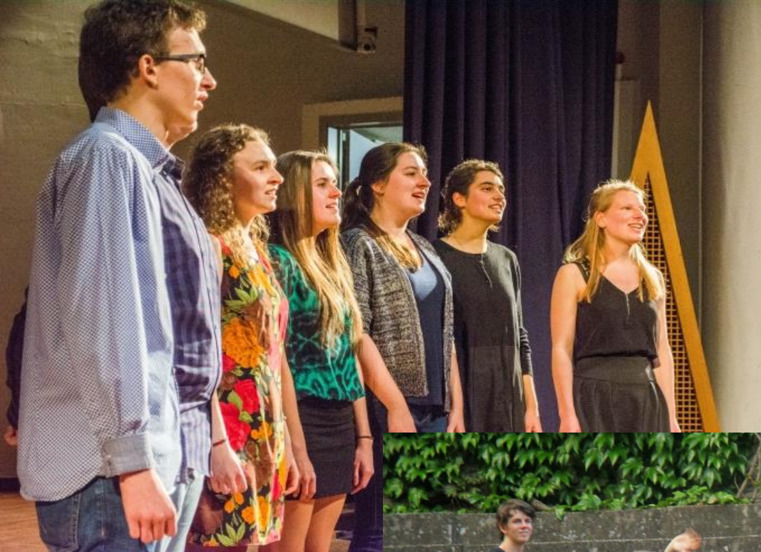
Op het lenteconcert zong het heropgeleefde winakoor ons eigen winalied.

Afscheid nemen is nooit leuk. Niet alleen nam EJW afscheid van de eerstejaars bij een kampvuur. Ook de laatstejaars namen plichtig van wina afscheid met hun zwanenzang.