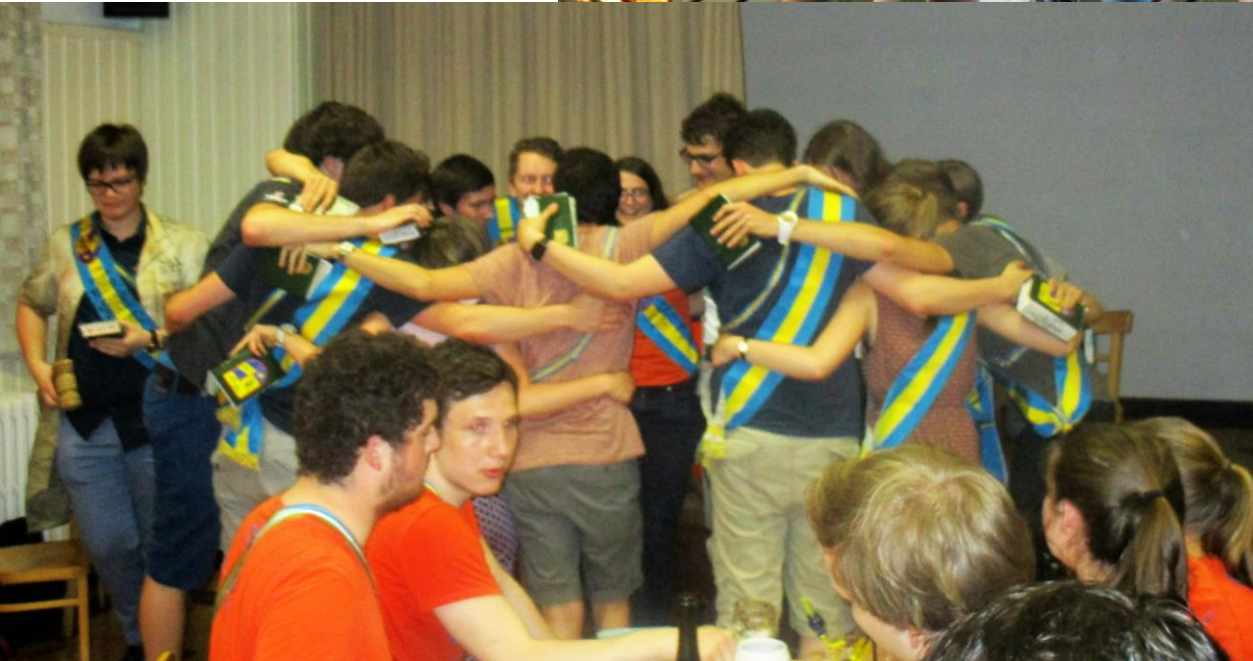
Het is echter nog niet volledig gedaan. De laatste week staat met de BBQ en de Avatarbar garant voor enkele onvergetelijke herinneringen en vergeet zeker ook niet te komen naar de après examenbar.