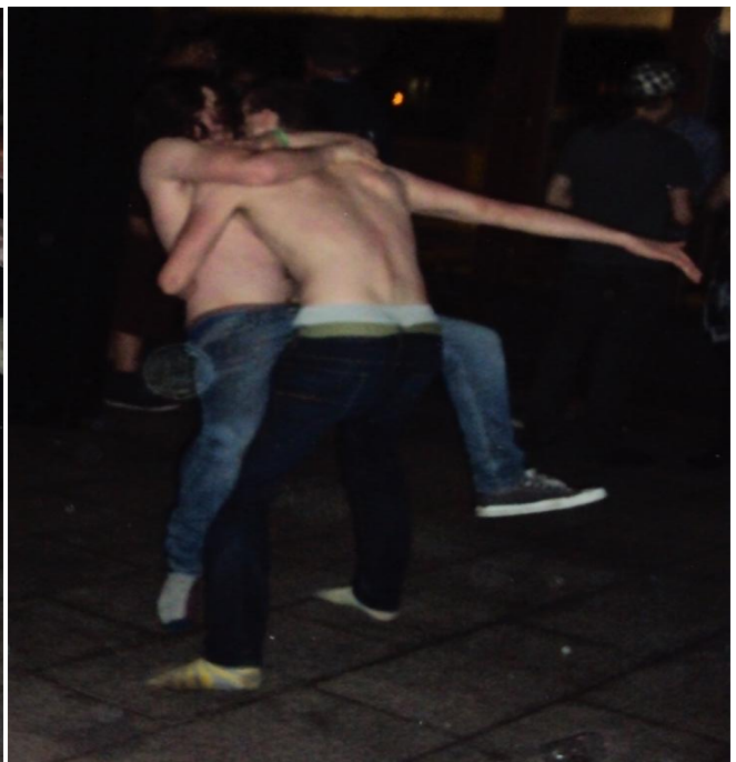
Een presidiumlid dat zich te pletter amuseert