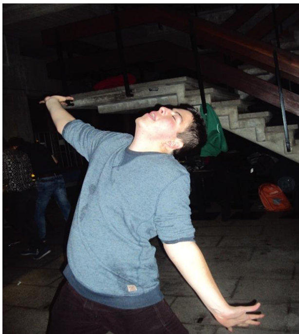
De gevolgen van MDMA op de bar