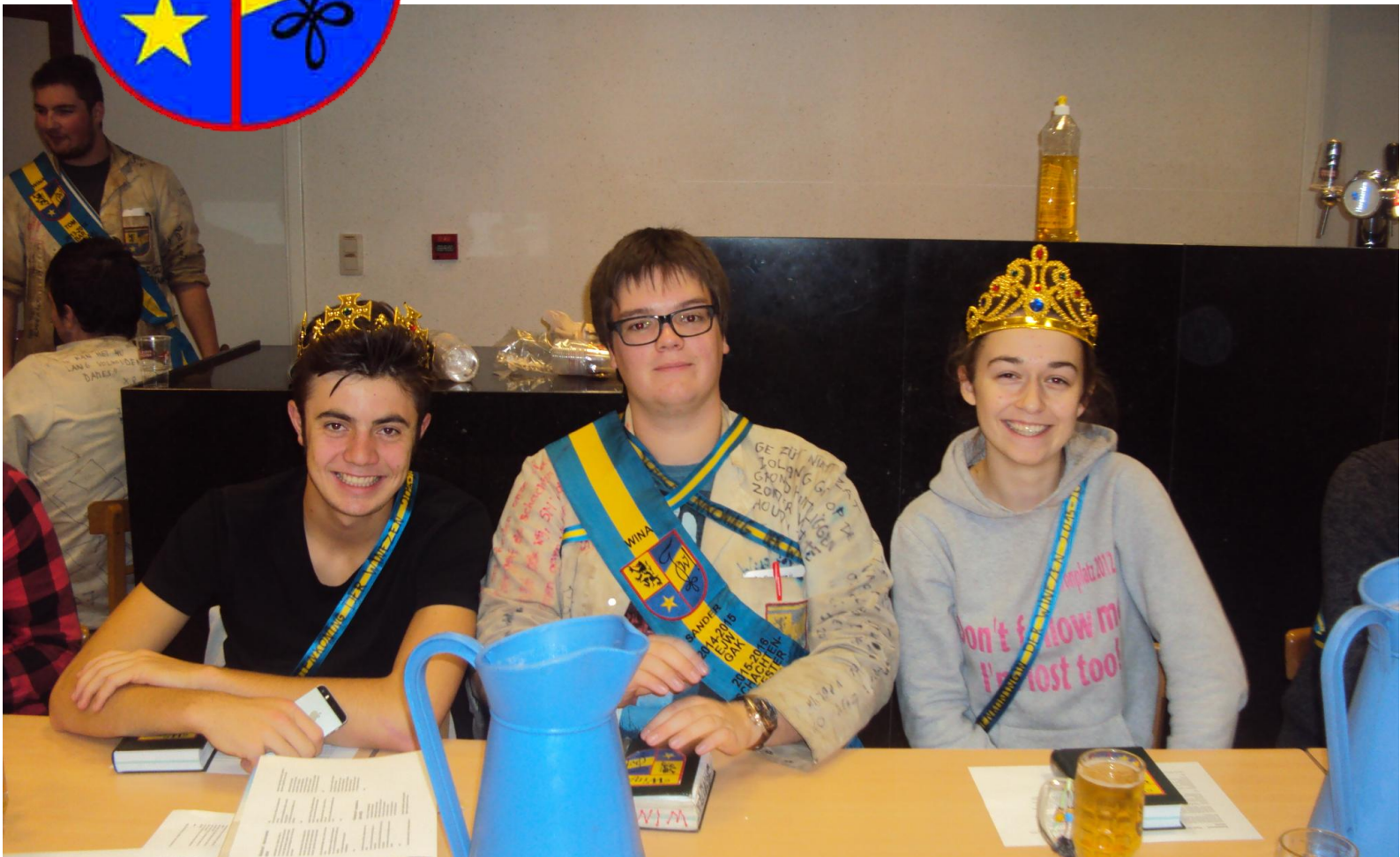
De schachtenmeester met zijn kersvers koningspaar

Wekelijks blaadje van studentenkring Wina verspreid onder studenten wiskunde, fysica en informatica.