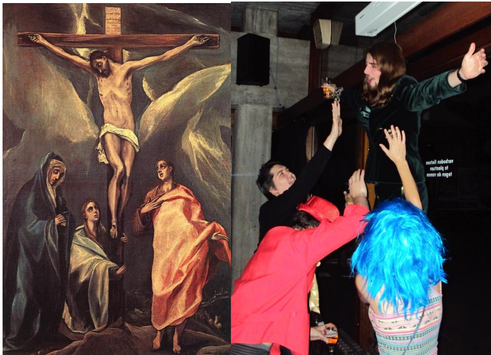
Een lid van ABBA op de discobar Jezus aan het kruis