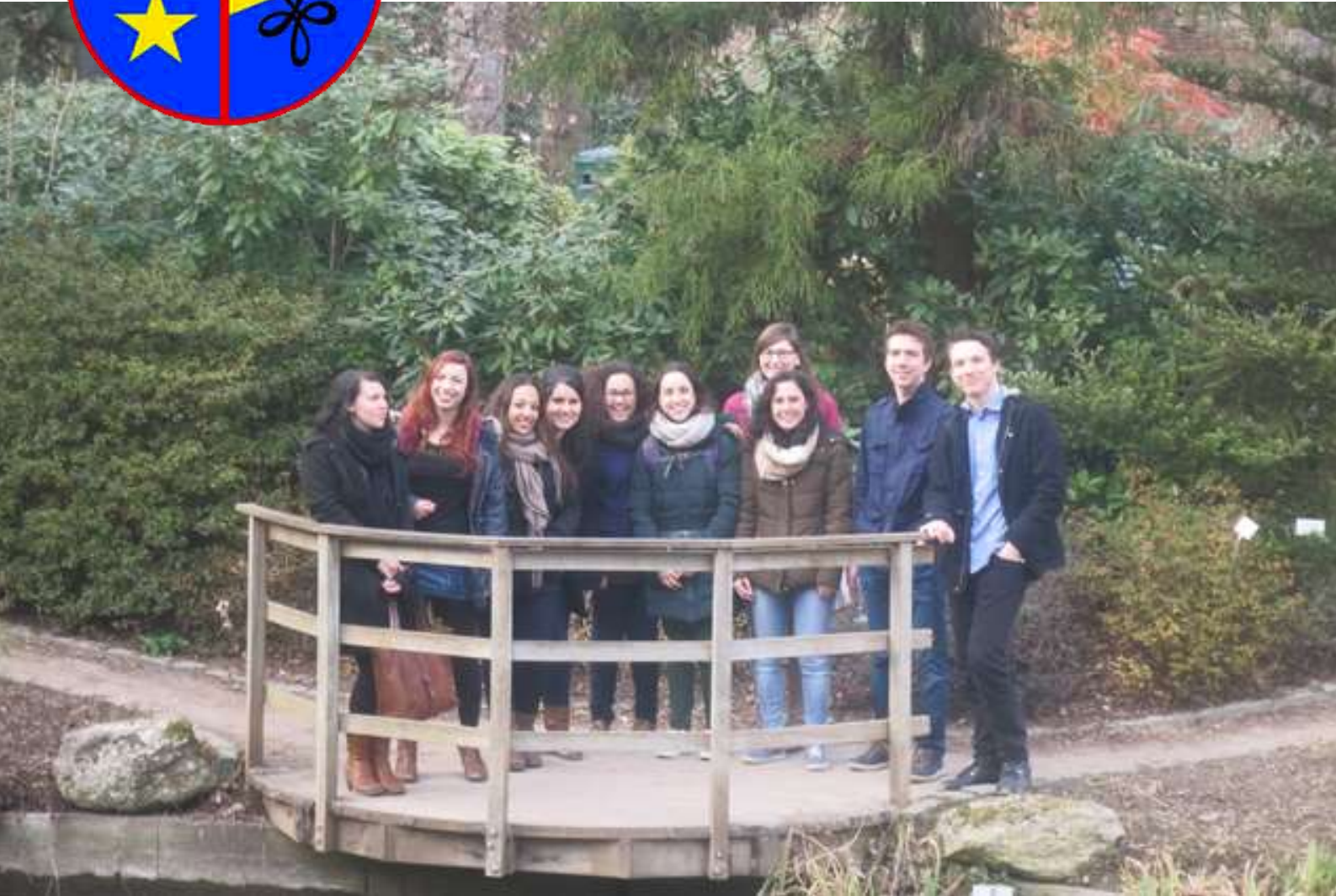
Groepsfoto op de stadswandeling

Wekelijks blaadje van studentenkring Wina verspreid onder studenten wiskunde, fysica en informatica.