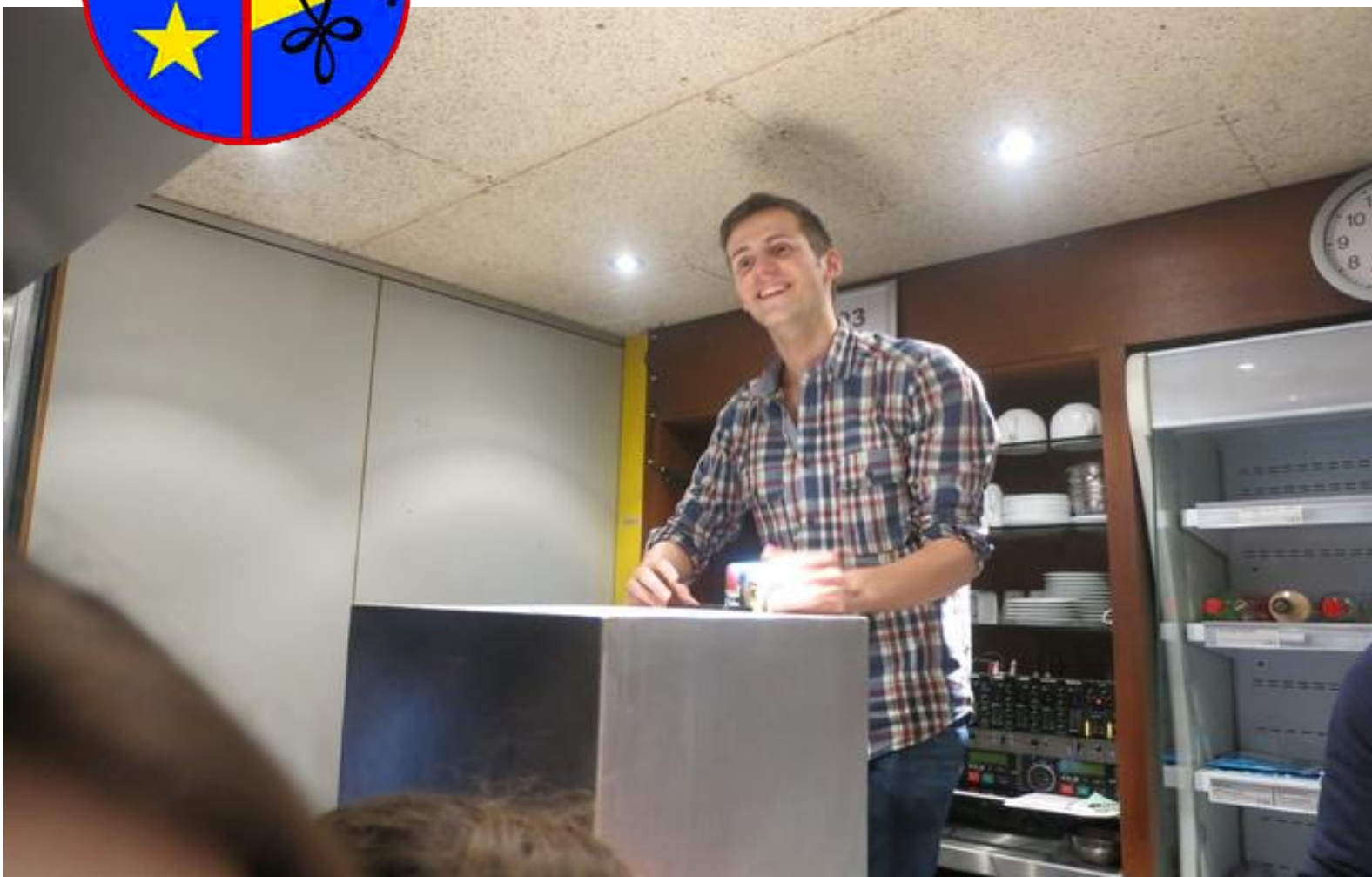
Dj Gustrogeen op de après skibar

Wekelijks blaadje van studentenkring Wina verspreid onder studenten wiskunde, fysica en informatica.