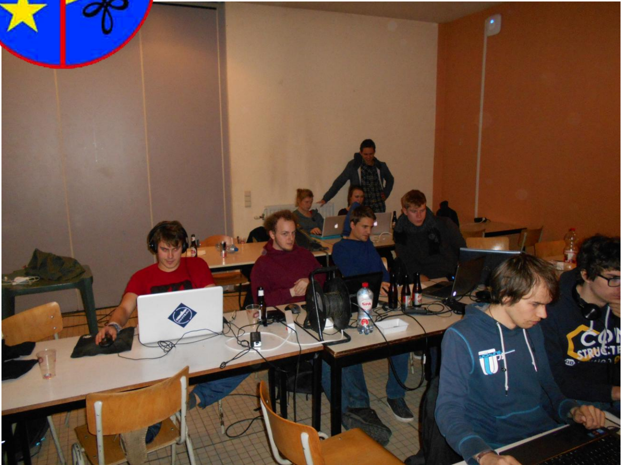
De 24h uren was een groot succes

twee maandelijks blaadje van studentenkring Wina verspreid onder studenten wiskunde, fysica en informatica.