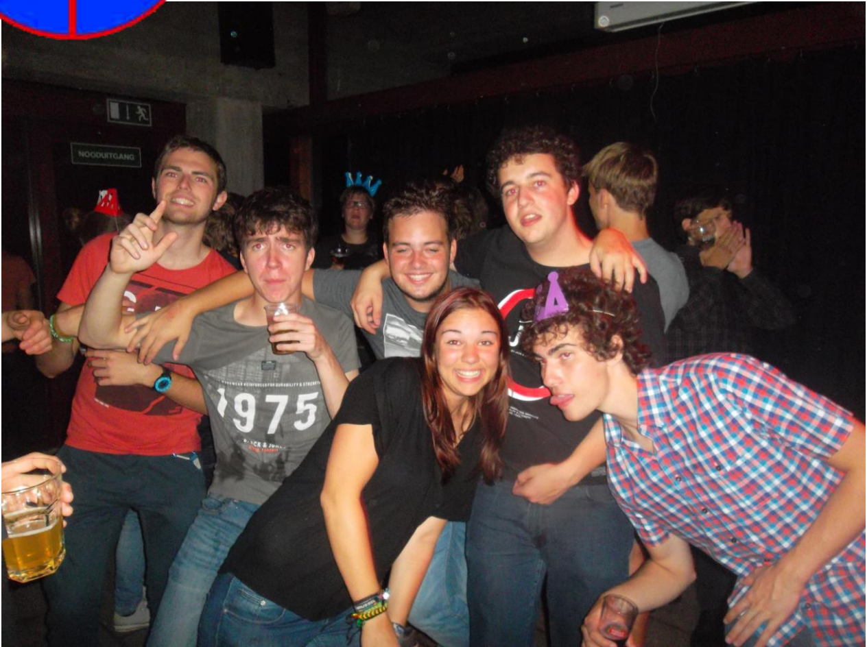
De eerste bar van het jaar

Wekelijks blaadje van studentenkring Wina verspreid onder studenten wiskunde, fysica en informatica.