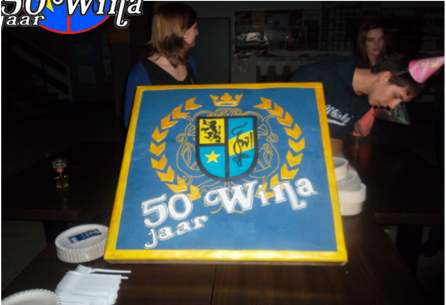
De overheerlijke Lustrumtaart

Wekelijks blaadje van studentenkring Wina verspreid onder studenten wiskunde, fysica en informatica.