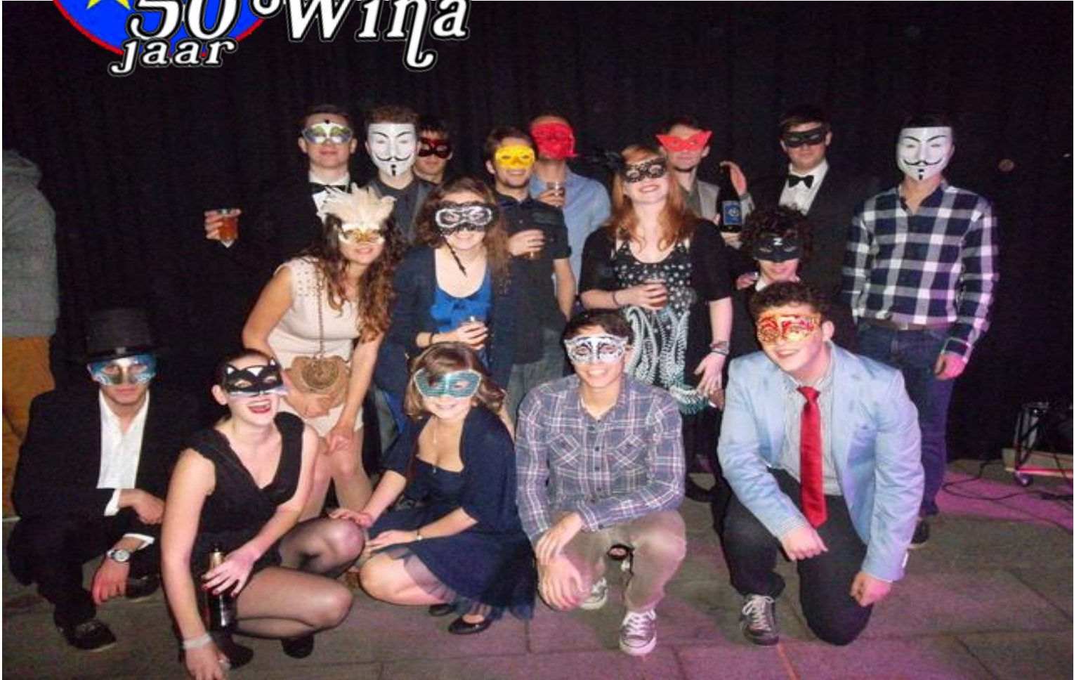
Groepsfoto op de Bar masqué