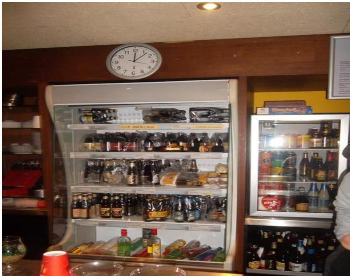
De collectie zware bieren