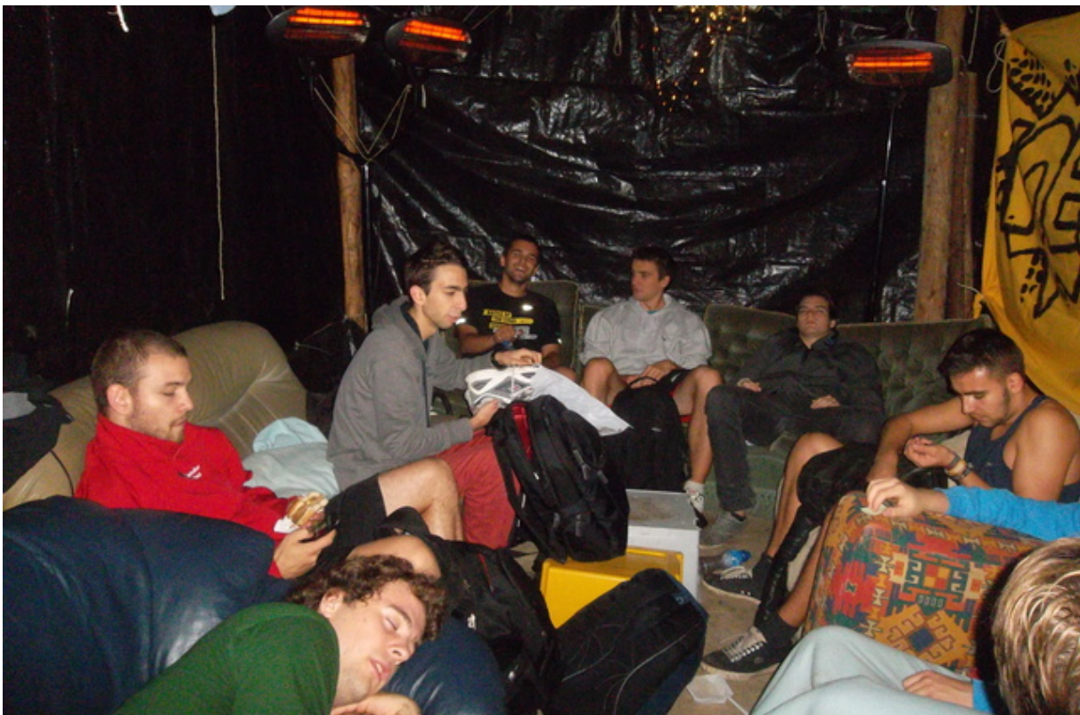
Sfeer troef in het loopstandje op de 24 urenloop!