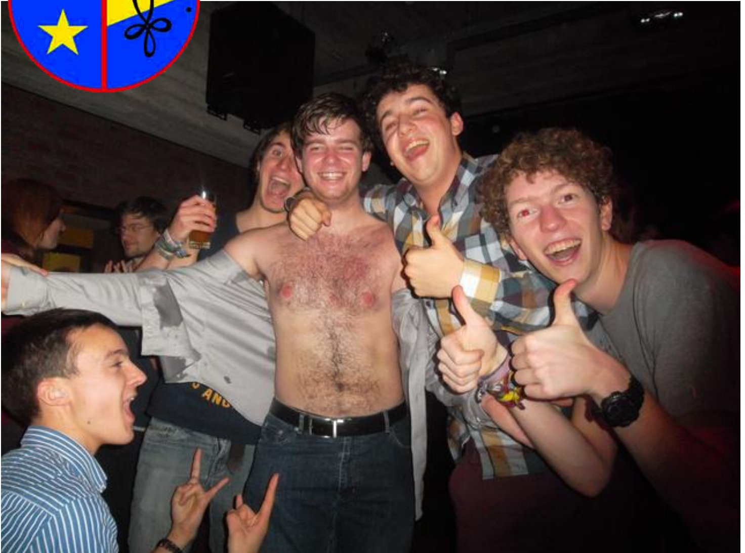
Robin - los - Der Oover en sympathisanten, GenreBar

Wekelijks blaadje van studentenkring Wina verspreid onder studenten wiskunde, fysica en informatica.